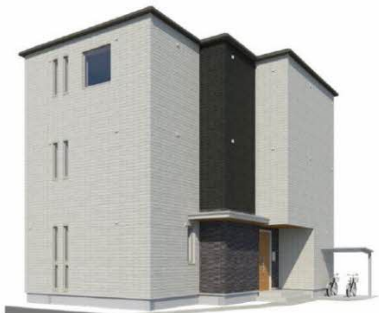
【完成予想図】実際の建物と異なる場合がございます。また、絵図中の周辺環境・植栽はイメージです。