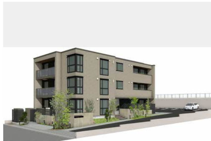
*写真は完成予想図です パースは実際の図面をもとに描き起こしたイメージで、実際のものとは異なる場合があります