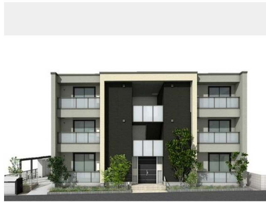
イメージバースとなります。実際とは異なります。