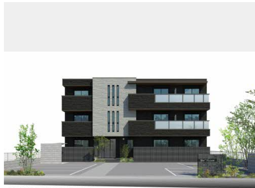
※イメージベース。実際の色柄・色調とは異なる場合があります。