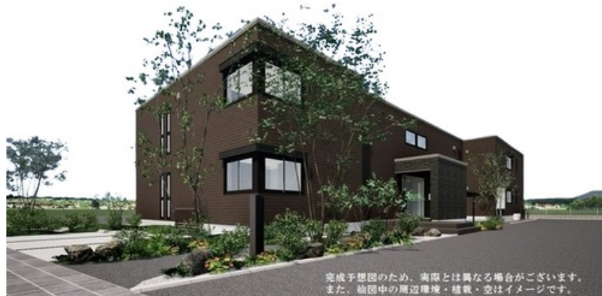
完成予想図のため、実際とは異なる場合がございます。また、絵图中的な周辺環境・植栽・空はイメージです。