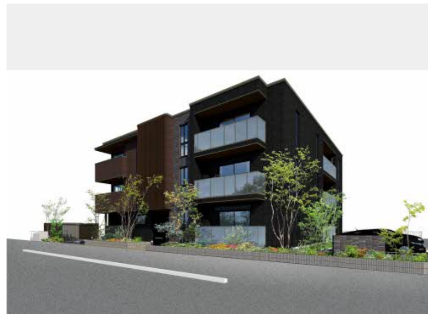
※写真はイメージです パースは実際の図面をもとに描き起こしたイメージで、実際のものとは異なる場合があります