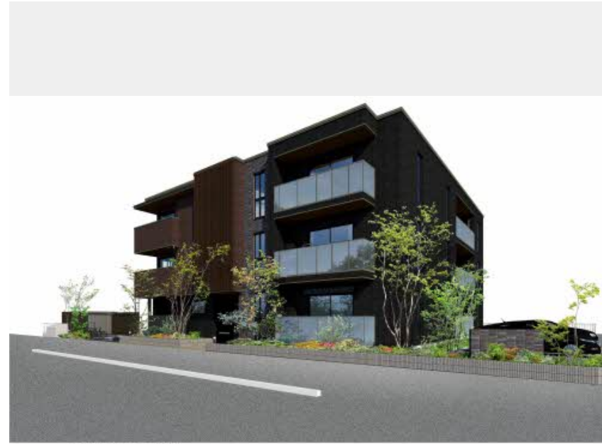
※写真はイメージです パースは実際の図面をもとに描き起こしたイメージで、実際のものとは異なる場合があります