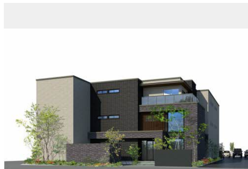
※写真はイメージです パースは実際の図面をもとに描き起こしたイメージで、実際のものとは異なる場合があります