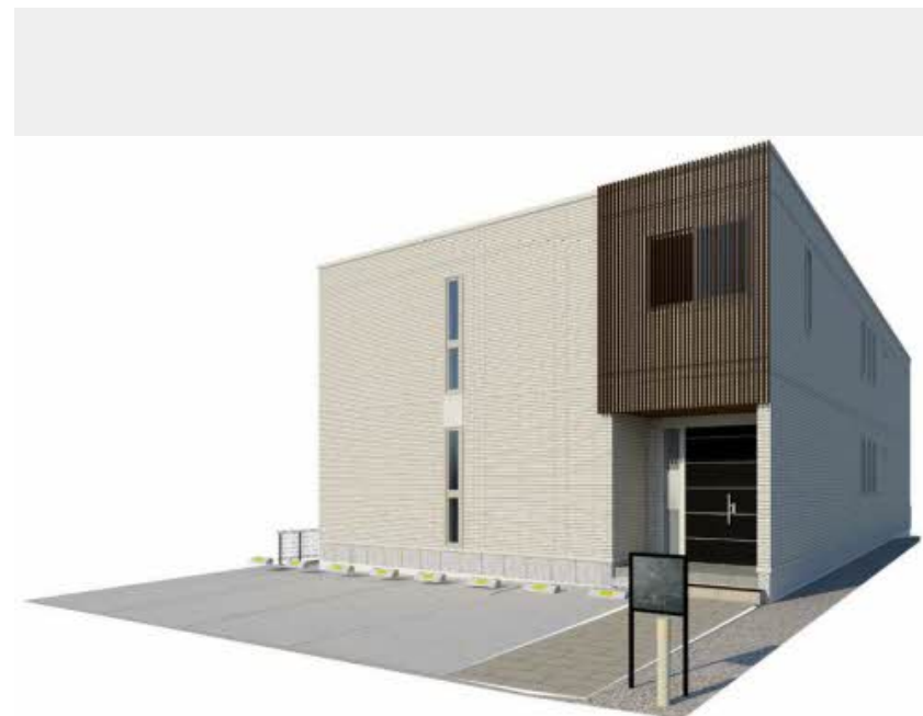
【完成予想図】実際の建物と異なる場合がございます。