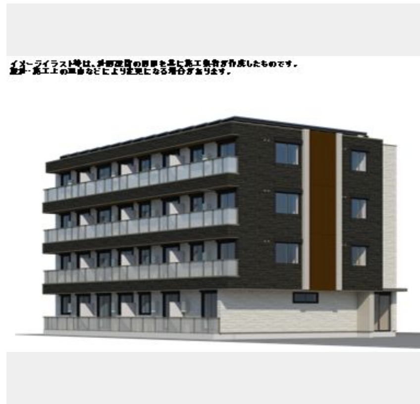
イメージイラスト等は、お部屋のイメージを基に施工業者が作成したものです。実際施工上の都合などにより変更になる場合があります。