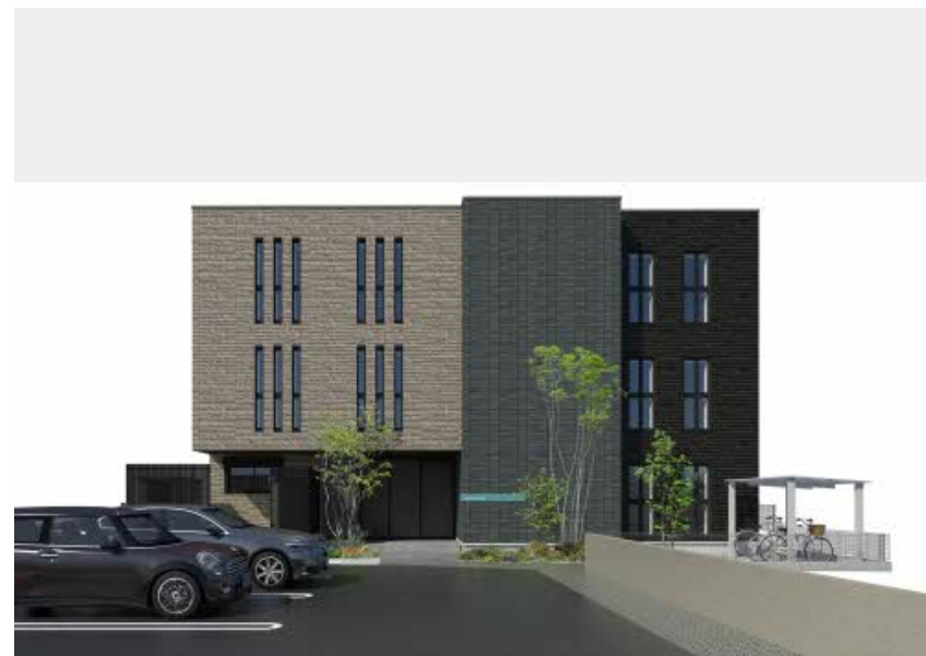
※写真はイメージです パースは実際の図面をもとに描き起こしたイメージで、実際のものとは異なる場合があります