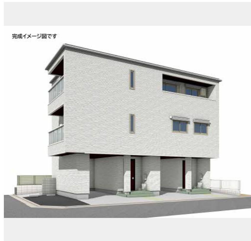
完成イメージ図です