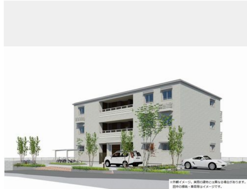
※外観イメージ。実際の建物とは異なる場合があります。図中の植栽・車庫等はイメージです。