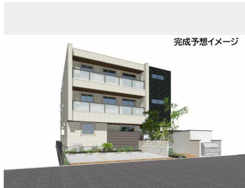
完成予想イメージ

こちらに掲載のイメージイラスト等は、計画段階の図面を基に描き起こしたものであり、設計・施工上の理由により変更となる場合があることを予めご了承下さい。