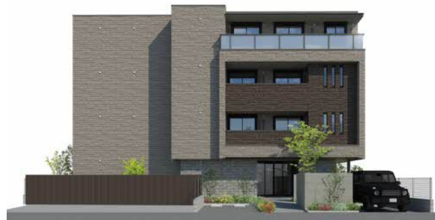
掲載のイメージ等は計画段階の図面を基に描き起こしたものであり、設計・施工上の理由により変更となる場合がございます。