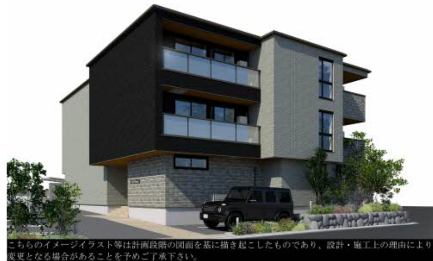
こちらのイメージイラスト等は計画段階の図面を基に描き起こしたものであり、設計・施工上の理由により変更となる場合があることを予めご了承下さい。