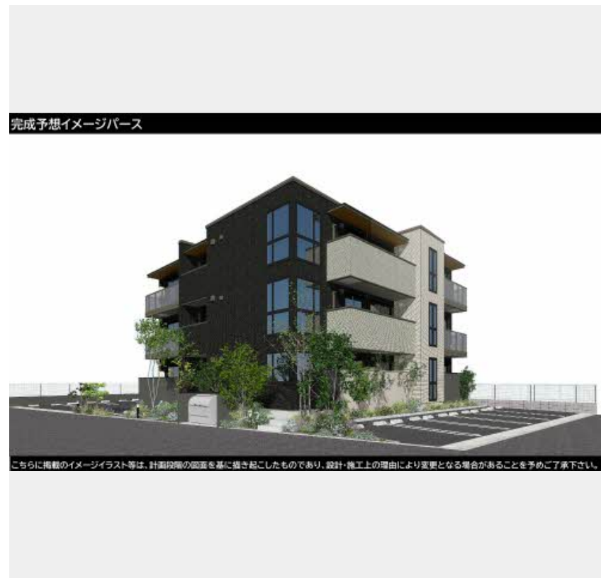
完成予想イメージパース