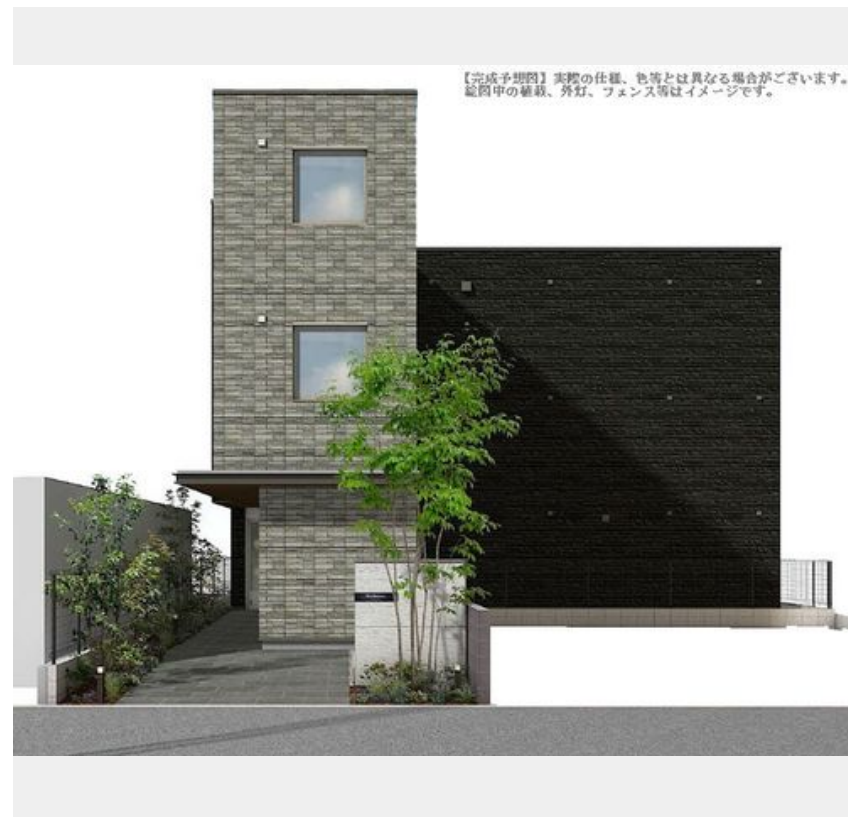
【完成予想図】実際の仕様、色等とは異なる場合がございます。配管中の給排水、電気、ガス等はイメージです。