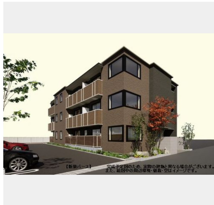
【新築バス】完成予定図のため、実際の建物と異なる場合がございます。また、総图中的周辺環境・植栽・空はイメージです。