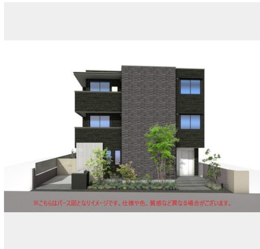
※こちらはパース図となりイメージです。仕様や色、質感など異なる場合がございます。