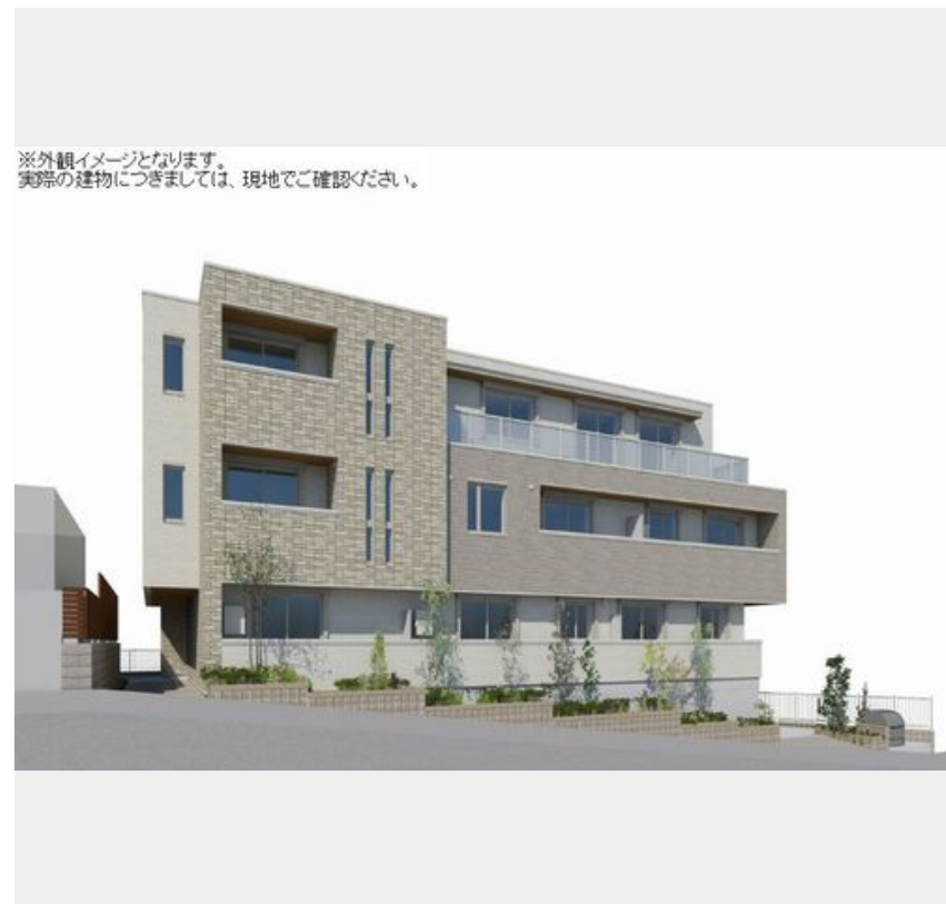
※外観イメージとなります。実際の建物につきましては、現地でご確認ください。