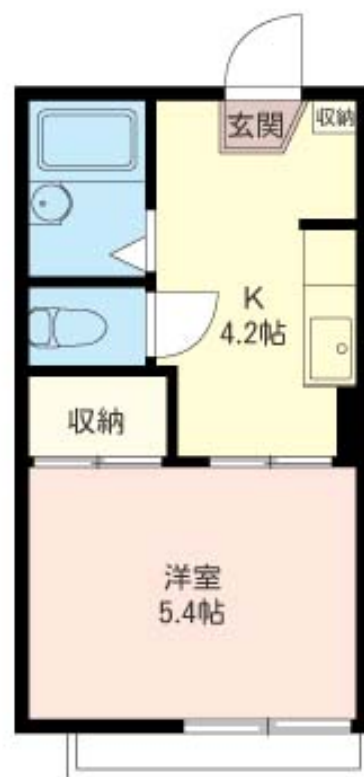
積水ハウスの賃貸住宅 シャーメゾン