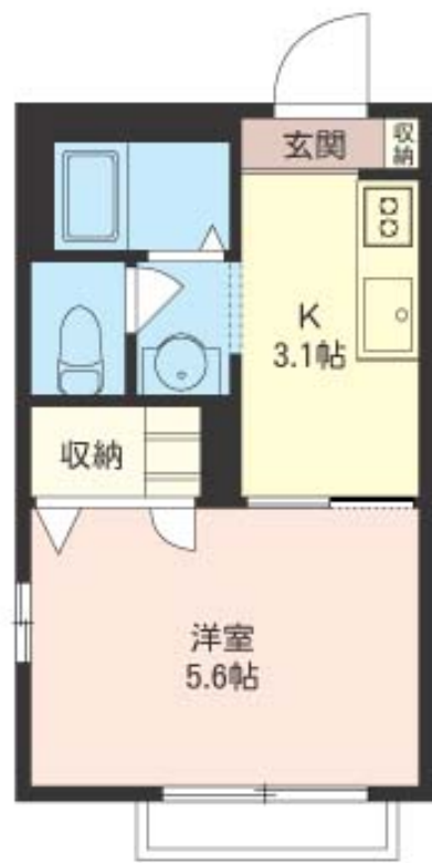
積水ハウスの賃貸住宅 シャーメゾン