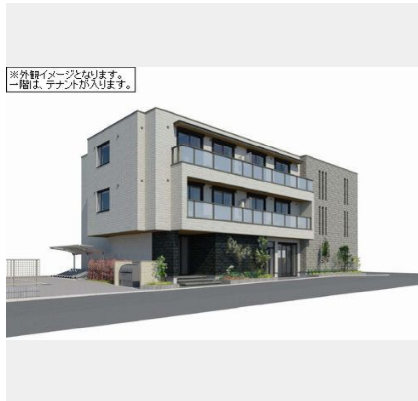
※外観イメージとなります。一階は、テナントが入ります。