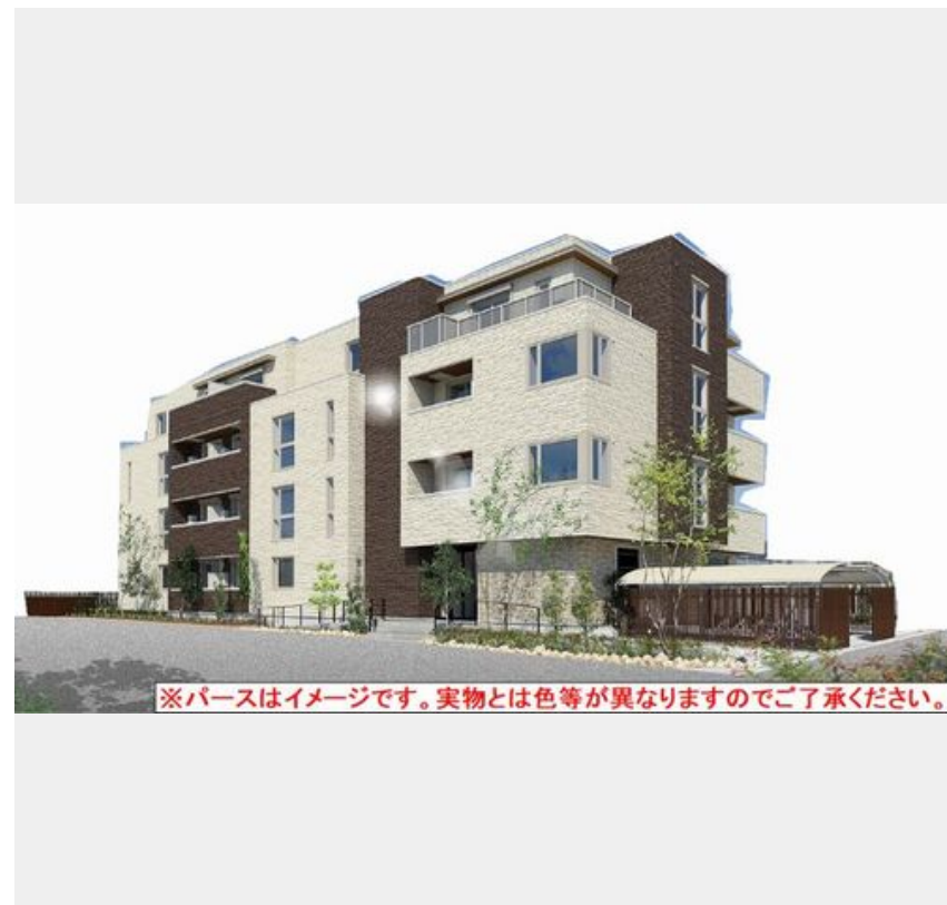
※パースはイメージです。実物とは色等が異なりますのでご了承ください。