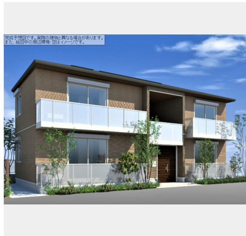
完成予想図です。実際の建物と異なる場合があります。また、絵図中の周辺環境・空はイメージです。