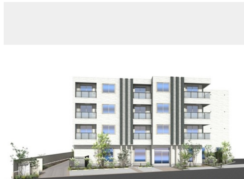
画像はイメージです。実際の完成建物とは異なる場合があります。