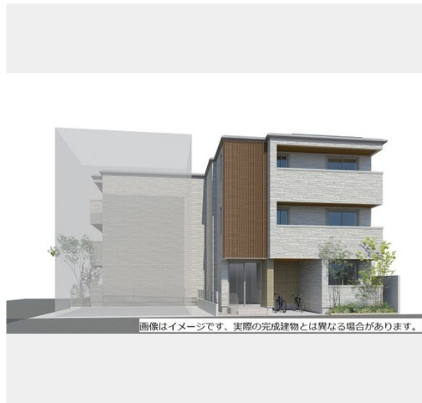
画像はイメージです、実際の完成建物とは異なる場合があります。