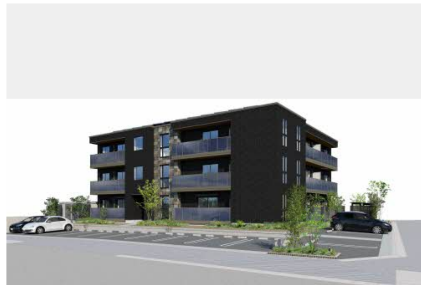
※写真はイメージです パースは実際の図面をもとに描き起こしたイメージで、実際のものとは異なる場合があります。