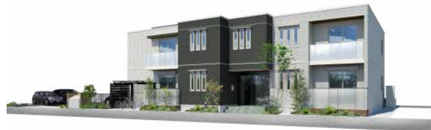
※写真はイメージです パースは実際の図面をもとに描き起こしたイメージで、実際のものとは異なる場合があります